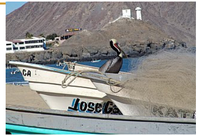
Vissersboten San Felipe