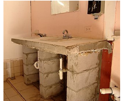
Wasgelegenheid RVpark San Felipe