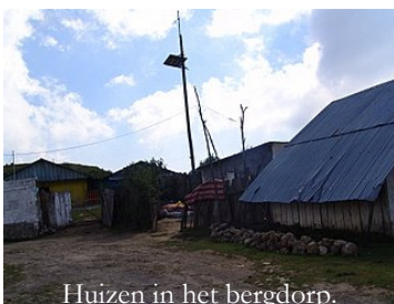
Huizen in het bergdorp.

Een van de broers, 12j, van de meisjes, samen met Fabian