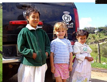
Mighalle met 2 meisjes, 4j en 7j, uit een bergdorp.