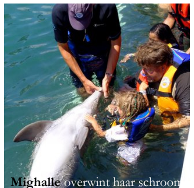
Mighalle overwint haar schroom