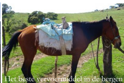
Het beste vervoermiddel in de bergen